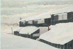
川崎小虎 雪の朝 1975 年

展示作品 《月宵》《道 (試作)》 《日月四季図 (プラン・小下図)》 東山画伯の義父である、日本画家・川崎小虎 (1886～1977)。慈愛あふれるその作品世界を、加藤コレクションを通じてご紹介いたします。