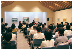
東山魁夷記念館コンサート 2007年