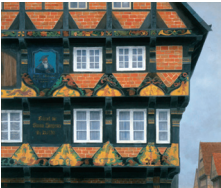
ツエレの家 1971 年

展示作品 《ツエレの家》《夏に入る》ほか 北欧へ、京都へ、ドイツ・オーストリアへ — 昭和 37～46 年にかけての東山画伯の遍歴の旅路を、さまざまな作品とともにご覧いただけます。