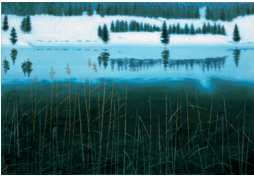
湖岸 (試作) 1991 年

展示作品 《緑の微風》《湖岸 (試作)》ほか いわれてみるとちょっと似ている、あの作品とこの作品。東山画伯の絵の新しい見方を提案する、夏休み親子美術入門教室です。