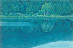
緑映 1988 年

展示作品 《夕汀》《静日》《緑映》ほか 東山魁夷記念館も開館して3年。この間新たに収蔵した、本制作や版画類をお披露目します。当館初公開も多数、必見の展覧会です。