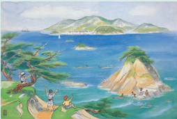
シマ 講談社の絵本 原画 1939 年 講談社蔵

東山画伯は、美術学校在学中から戦前を中心に、数多くの童画を手がけています。知られざる東山魁夷 童画の世界を一堂に展観します。