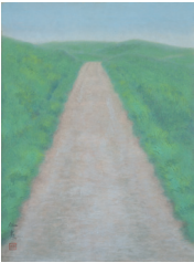
道 (試作) 1950 年

展示作品 《ツエレの家》《夏に入る》ほか 北欧へ、京都へ、ドイツ・オーストリアへ — 昭和 37～46 年にかけての東山画伯の遍歴の旅路を、さまざまな作品とともにご覧いただけます。