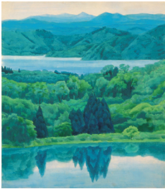
萬緑新 (中下図) 1961 年

展示作品 《萬緑新 (中下図・大下図)》ほか 東山芸術の魅力进行分に伝える、迫力の大型リトグラフィ。森工房が手がけた《静映》《瀟声》《緑の詩》《山嶺湧雲》を一堂に展示します。