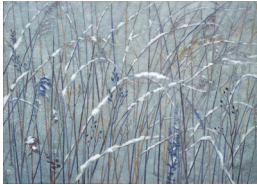
雪野 1992 年

展示作品 《雪野》ほか 唐招提寺障壁画の制作をへて、画伯の旅は新たな時代を迎えます。東山芸術後期の展開を紹介する、シリーズ第三部です。