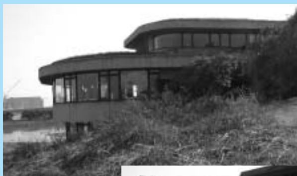
土に覆われた環境学習施設 (東京港野鳥公園)