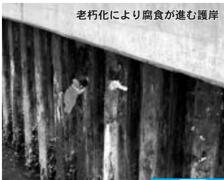
老朽化により腐食が進む護岸

「自然との共生」、「協働による創造」によって、自然特性や交通条件のよさを活かしながら、これからの都市のあり方や先駆的な都市づくりの取り組みを示す重要な役割を担います。