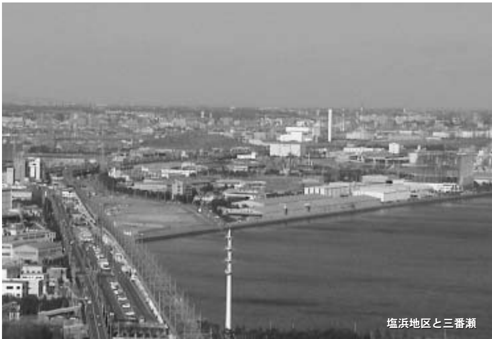
塩浜地区と三番瀬