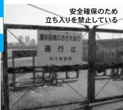
安全確保のため立ち入りを禁止している

直立護岸のため、直接海と触れ合うことができません。また、埋め立てを前提とした暫定護岸(埋め立て計画は千葉県が中止を表明)のため、高潮、高波を防ぐ高さがなく、腐食も激しく、崩壊の危険があるため、市は立ち入りを禁止しています。