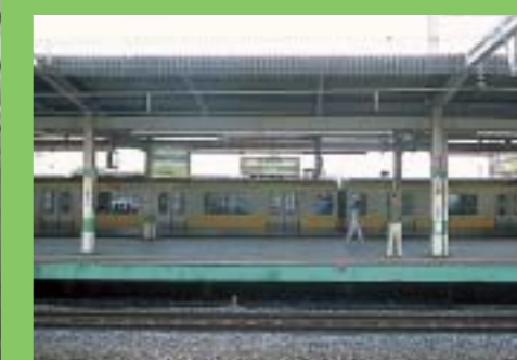
2003年。現在のような高架になったのは1970(昭和45)年7月。

「駅前では何でもそろそろ、食堂、カフェ、芸者衆のいる料亭もあって本当ににぎやかでした。東京から著名人や政治家も遊びに来ていました。それから国府台連隊・部隊の軍人がよく来ていましたよ。それがシナ事変以降は一度に1000人、2000人の軍人たちが市川駅から出兵したこともあった。たくさん見送りの人が来て悲しい別れがあつてね。当時はこれも駅の一つの役目だったんです。」と語る。