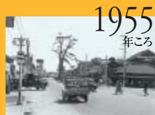
1955(昭和30)年ころ。市川駅前ロータリーと国道14号が交わる交差点。東京から帰ってくるときには、市川橋からこの交差点が見えた。

「仕方がないからそこにイモとかダイコン、キュウリを植えたんだけど実らなかった。商人だからさ、農業は知らないんだよね。」と当時を振