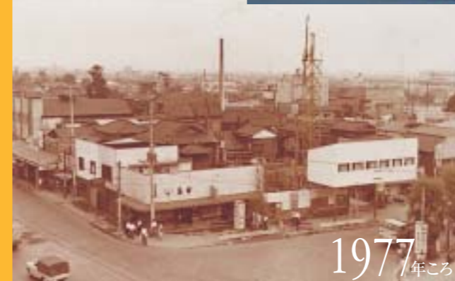
1977(昭和52)年ころの市川駅前ロータリーと国道14号が交わる交差点。

市川駅前に暮らし、何代も続く商店で定点観測を続けてきた人々にインタビューを試みました。「昔の写真をお持ちですか?」「昔の話を聞かせてください。」市川駅北口の古い写真を探し歩き、さまざまな人に出会いました。大正生まれのおばあちゃん、昭和生まれのおじさん、おばさんたちに聞いた思い出の場所、人、出来事。どのかたも、まるでつい最近の事を話すかのように語ってくれます。そして「うちの写真は焼けちゃったけど、あの店の人なら誰かがまだ持っているかもよ」と紹介してもらうちに、何代も前から続く人情味あふれるネットワークが垣間見えました。さあ、ひととき立ち止まって、数十年前にタイムスリップしてみましょう。あなたはどのような変化を感じますか?