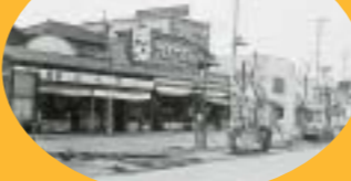
ほぼ同時期の亀井商店の姿。