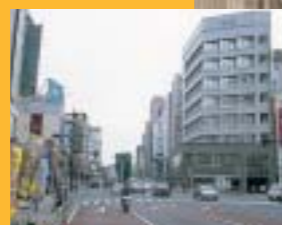
2003年。建物は軒並みビルになり、店主も代替わりし、まちの風景はずいぶん変わったが、今も変わらず気さくで元気、あたたかな人々に出会えるまち。