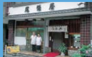
現在の尾張屋うなぎ店。

1951(昭和26)年ころ。1946(昭和21)年創業の尾張屋うなぎ店は、現在も変わらない場所で店を構えている。写真の看板は舟の廃材でつくられたもの。